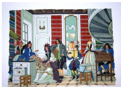
La servante justifiée