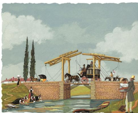
La diligence de Beaucaire Lettres DMM