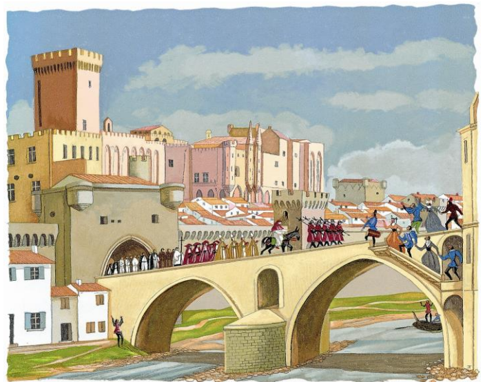
La mule des Papes