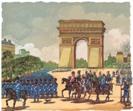
Le siège de Berlin Contes du lundi