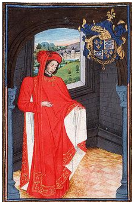
Le duc Charles d'Orléans en habit de chevalier de l'ordre de la Toison d'or.