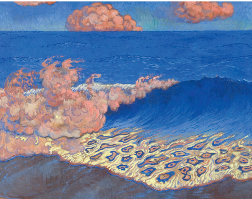
Georges Lacombe Marine Bleue, Effet de Vague , entre 1892 et 1894. Tempéra sur toile, 49,5 x 65,5 cm Rennes, musée des beaux-arts

De la Bible à Le Clézio, en passant par Homère, Virgile, Rabelais, Shakespeare, Racine, Melville, Jules Verne, Proust, García Lorca, Camus... Une magnifique invitation au voyage.