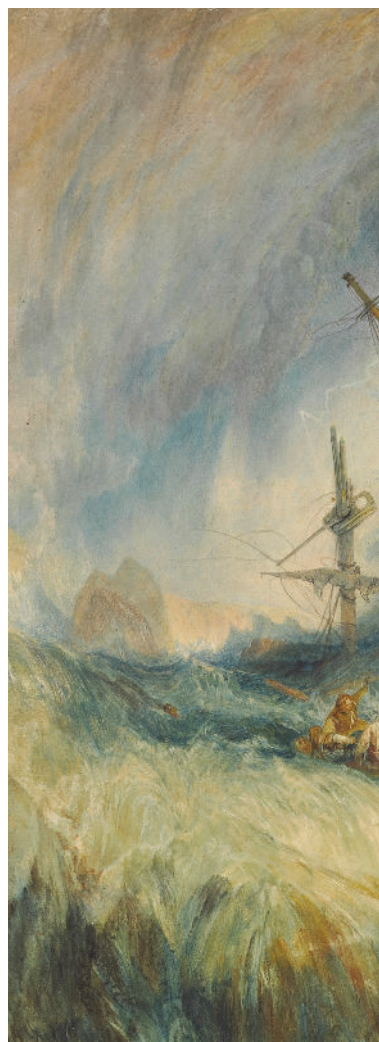
William Turner Tempête , 1823. Aquarelle sur papier, 43,4 × 63,2 cm Londres, British Museum